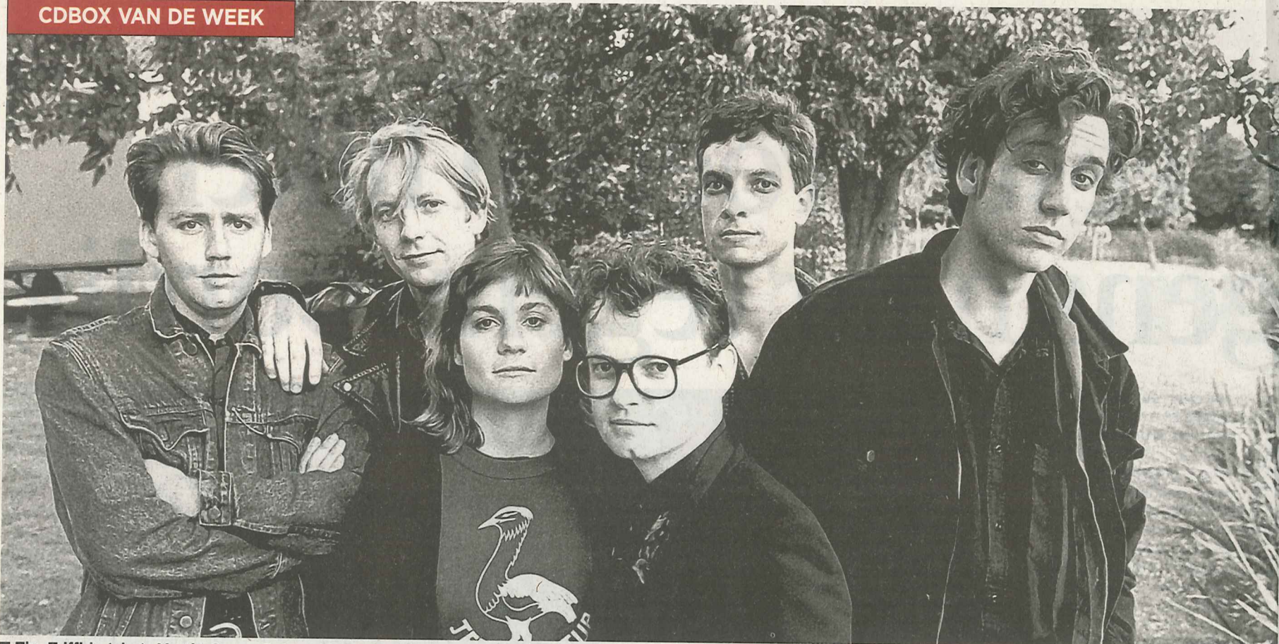
■ The Triffids (vlnr): Martin Casey, Robert McComb, Jill Birt, Graham Lee, Alsy MacDonald en David McComb.