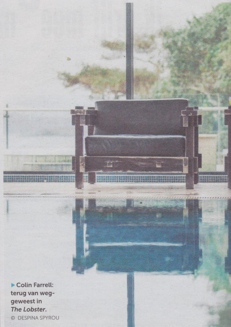
► Colin Farrell: terug van weg geweest in The Lobster .

'IK WERD TRIESTIG VAN MIJN FILMBUIK. DIE SPEKLAAG VERANDERDE ALLES. IK WERD ER EEN ANDER MENS DOOR'